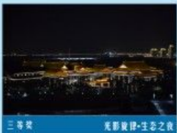
三等奖 光影旋律·生态之夜