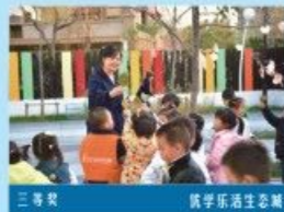
三等奖 悦享生活生态城