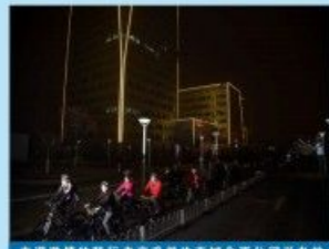
充满激情的骑行者享受着生态城合资公司举办的“绿色骑行·蓝色WE来”活动所带来的乐趣。

此次夜间骑行活动吸引了50余名参与者，共同绕生态科技园环路骑行6公里。本次活动主题为“绿色骑行·蓝色WE来”，与2017年地球一小时中国区主题“蓝色WE来”相结合。这是生态城合资公司第六次参与这项全球性的地球一小时活动，彰显了其致力于保护环境的坚定决心。