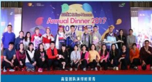
高管团队演讲时获奖