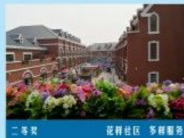
二等奖 花样社区 多样服务