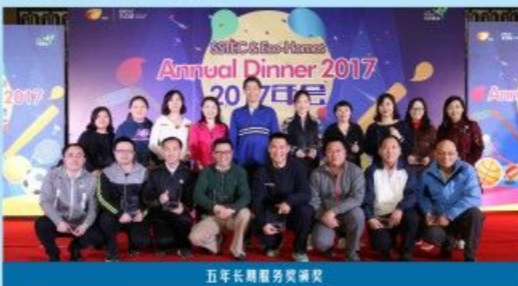
五年长期服务获奖颁奖

生态城合资公司于2017年3月3日举办了公司年会，现将活动当天的照片呈现给大家。