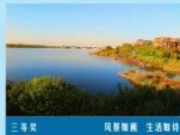
三等奖 风景如画 生活如诗