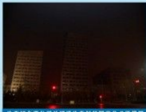
生态城合资公司关闭了生态科技园内非必要使用的电灯及电器，以支持地球一小时活动。