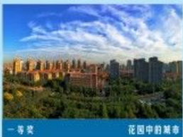
一等奖 花园中的城市