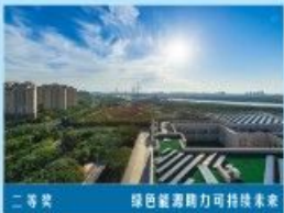
二等奖 绿色能源助力可持续发展