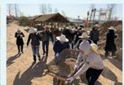
党员同志们在张庄体验治理三害。