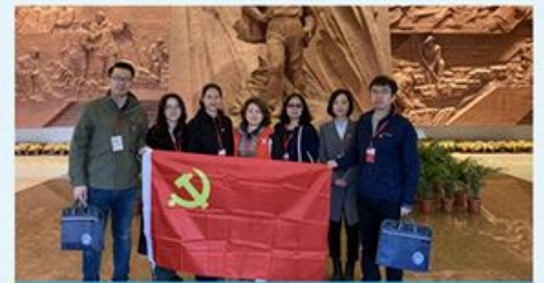
合资公司党员赴河南进行专题教育培训。

2019年3月10日至14日，按照投资公司党委统一安排部署，生态城合资公司党支部委派7名党员同志随投资公司党委其他40名党员同志共同奔赴河南参加2019年第一期“不忘初心 砥砺前行”专题教育培训活动。此次培训旨在提高党员同志的党性修养、政治觉悟，增强艰苦奋斗、团结协作的精神，从而以更加饱满的精神状态和工作热情投入到生态城的建设发展中。