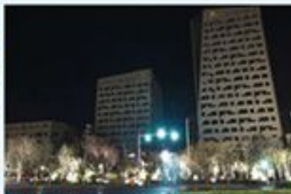
生态城合资公司关闭了生态科技园内非必要使用的电灯及电器，以支持地球一小时活动。

标本，使参观者更加深入地了解和体会了地球丰富而脆弱的生物多样性，增强了参观者保护生物多样性的意识。