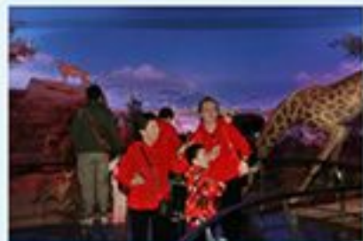
参观者在天津自然博物馆的展品前驻足。

被邀请的公众早前参与了生态城合资公司在其微信公众号上发起的关于生物多样性的有奖问答活动，并答对了全部题目，因此获得了携家人参观天津自然博物馆的机会。展馆中关于地球家园38亿年来自然界演化历程的展品，以及200多件世界珍稀野生动物