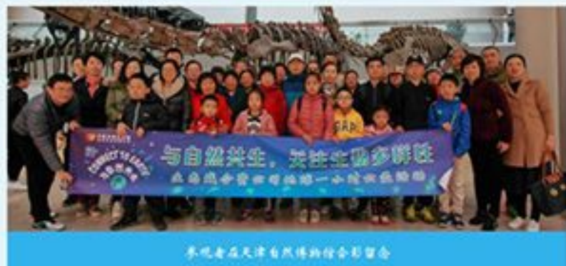
生态城合资公司组织员工及家属参加地球一小时活动。

标本，使参观者更加深入地了解和体会了地球丰富而脆弱的生物多样性，增强了参观者保护生物多样性的意识。