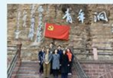
合资公司党员在焦裕禄纪念馆参观学习。

培训班一行首先来到了“焦裕禄精神”的发祥地——兰考县。在这里，党员同志们参观了焦裕禄纪念馆、纪念馆、黄河东坝头和张庄等地，全面深入的了解了焦裕禄带领兰考县人民以战天斗地的精神，治理“三害”（风沙、盐碱、内涝）的感人事迹，学习了焦裕禄全心全意为人民服务，鞠躬尽瘁、死而后已的伟大精神。在张庄，党员同志们还体验了治理三害