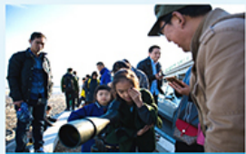
摄影爱好者为珍稀鸟类拍摄生态城观鸟地——逸园公园合影留念

2018年10月27日，正值金秋，生态城合资公司再次携手生态城文化旅游局、社会和天津市滨海新区滩涂湿地保护中心，共同在生态城举办“我与鸟儿有个约会——中新天津生态城第四届观鸟护鸟公益活动（秋季）”，在丰富居民业余生活的同时，持续提升他们对环境和鸟类的保护意识，促进人与环境的和谐发展。