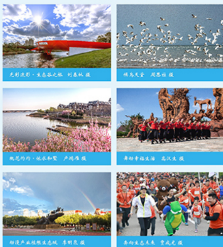
光影流影·生态谷之桥